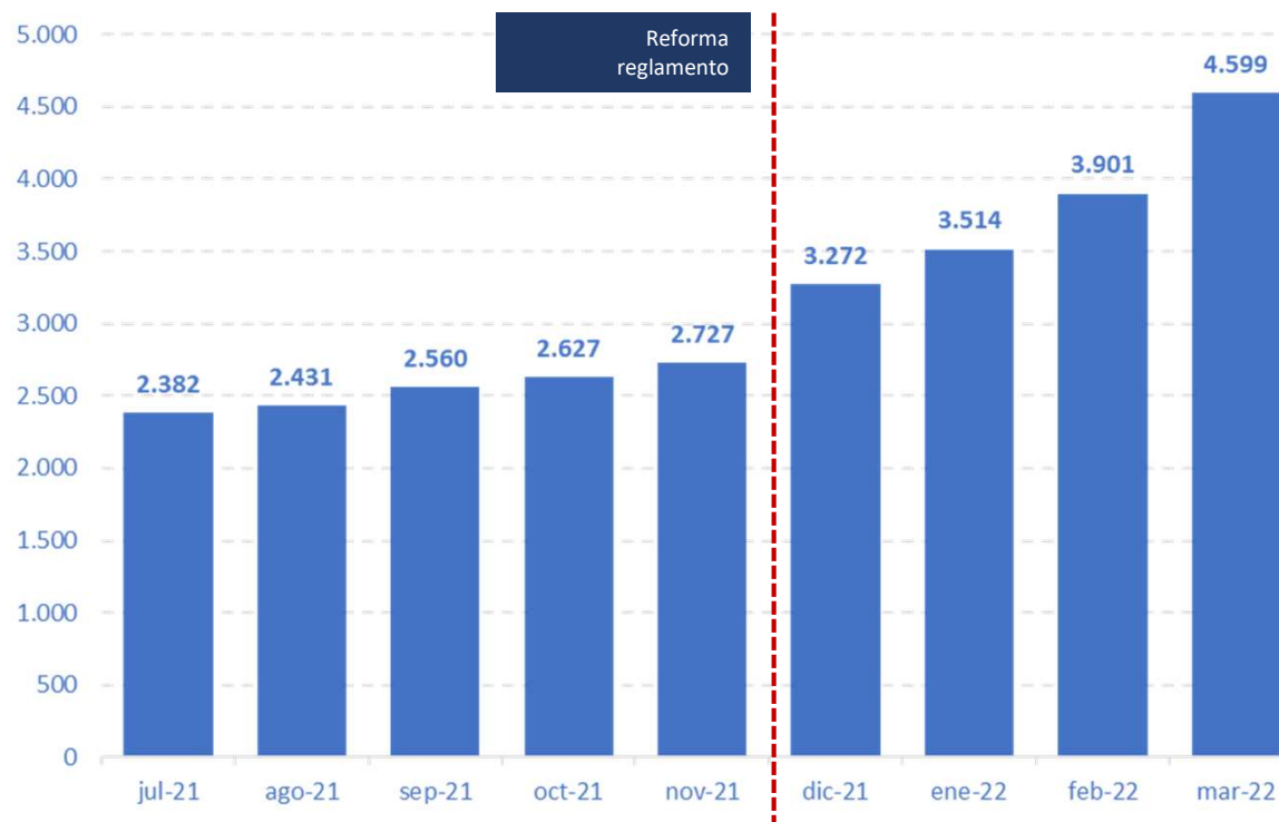
Menores y jóvenes extutelados en alta laboral

El número de menores y extutelados trabajando prácticamente se ha duplicado desde la puesta en marcha de la reforma