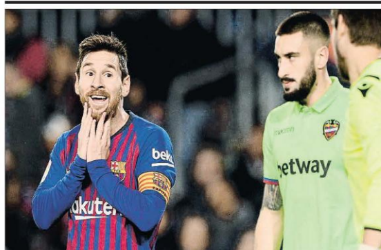
Clasificación en suspenso. El Barça goleó al Levante (3-0) y jugará los cuartos de final de la Copa si las autoridades deportivas no dictaminan lo contrario por la posible alineación indebida de Chumi en el partido de ida. DEPORTES 46 A 48

► El diputado optará a la Comunidad con la plataforma de la alcaldesa, Más Madrid ► Iglesias le desea "suerte" y Podemos presentará a otro candidato POLÍTICA 15