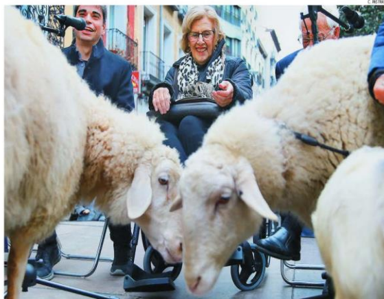
LA OVEJA NEGRA. Camera, ayer, durante un acto con animales en la fiesta de San Antón de Madrid, abrió a la integración de la invidente