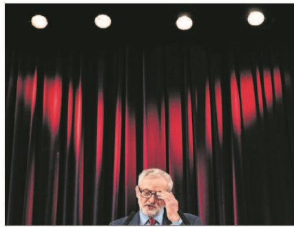
Jeremy Corbyn, líder del Partido Laborista británico, ayer en un discurso en Hastings.