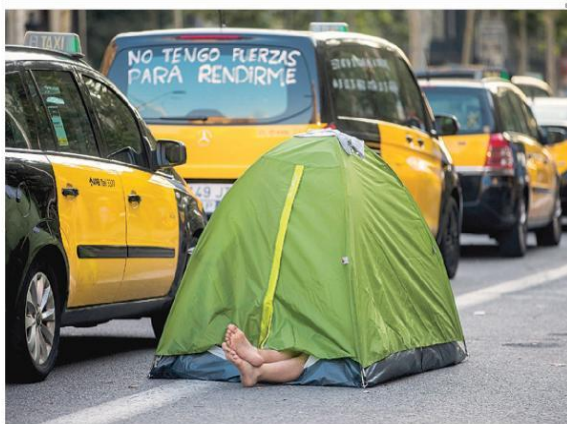
Los taxistas han acampado en las calles de Barcelona a la espera de cerrar un acuerdo con Fomento, que ha pedido «responsabilidad» al sector

En el encuentro, previsto para mañana, el sucesor de Rajoy exigirá reforzar las instituciones frente al soberanismo p. 10