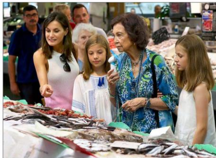
La Reina Letizia, ayer, junto con sus hijos Leonor y Sofía y la Reina Emérita Doña Sofía, en el Mercado del Olivar de Malloca. 171

Y el verbo se hizo carne. Para entendernos: después de mucho suspense, apareció la Reina Magnífica (o Emérita), recién llegada de los Grandes Lagos (EEUU), tras pasar unos días en compañía de la Infanta Cristina y sus hijos. Doña Sofía está a todo: a los hijos (lenguaje inclusivo, pues allí están comprendidos también las hijas, así como los yernos y las nueros) y los nietos, a Ginestra y a Malloca, a las obligaciones y a las diversiones. SÍGUE EN PÁGINA 22 / PAPEL