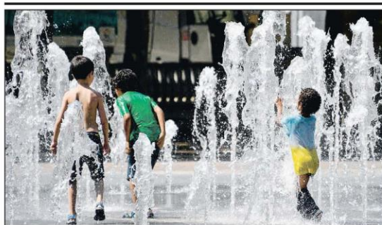
Llega la primera ola de calor. Las temperaturas ya han empezado a subir notablemente en toda Europa (en la foto, una plaza de Montpeller) y a partir de hoy se situarán en la Península entre 5°C y 10°C por encima de los valores normales. TENDENCIAS 20 Y 21

El juicio contra Paul Manafort, jefe de campaña de Donald Trump, se inició ayer con la elección del jurado. Aunque el caso se centra en una acusación de fraude, la condena daría poder al fiscal para seguir la pista del Rusiagate. INTERNACIONAL 5