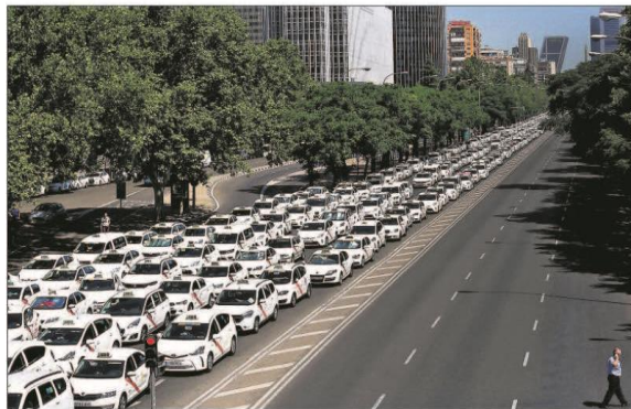
LOS TAXISTAS MANTIENEN LA PROTESTA. Los taxistas anunciaron ayer que mantendrán la huelga tras fracasar la reunión con Fomento y volvieron a colapsar las grandes ciudades. En la foto, el paseo de la Castellana en Madrid. PÁGINAS 29 A 31 / BLOQUE DE LA MANA 30