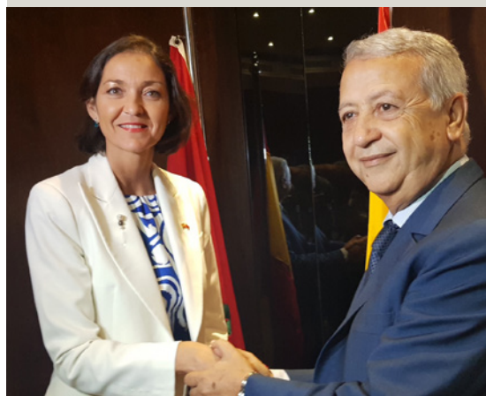
La Ministra de Industria, Comercio y Turismo de España, Reyes Maroto, durante una reunión con el Ministro de Turismo de Marruecos.

Es objeto de atención estratégica dentro del Foco África 2023. Los sectores prioritarios identificados son: el agroalimentario, en particular, el desarrollo agroindustrial; el del agua y saneamiento y de tratamiento de residuos; el de ingeniería y consultoría; el energético, con especial énfasis en energías renovables; el de las infraestructuras de transporte; el químico y farmacéutico; y el de la transformación digital. Se actuará con i) medidas concretas para potenciar los mecanismos financieros de apoyo a la inversión de empresas españolas en África, incluyendo el apalancamiento de fuentes de financiación multilaterales, de la UE y del Banco Europeo de Inversiones; y ii) apoyo institucional a los operadores económicos españoles; iii) movilización del sector privado.