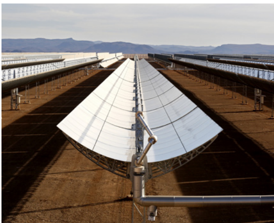
Placas solares de la megaplanta solar de Uarzate, en el sur de Marruecos, construida por un consorcio español.