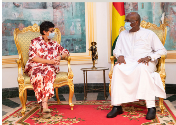
La Ministra de Asuntos Exteriores, Unión Europea y Cooperación, con el Presidente de Burkina Faso.

Sin paz y seguridad, ningún esfuerzo puede fructificar. Los esfuerzos para el desarrollo sólo pueden ser eficaces en un entorno seguro. Seguridad y desarrollo son un binomio insoluble que debe ser reforzado con las acciones humanitarias. Algunas medidas destacadas: i) reforzar el nexo paz, seguridad y desarrollo en el Sahel, y la presencia del Estado en zonas frágiles; ii) desarrollo de las capacidades militares en países de la costa occidental de África y el Golfo de Guinea; iii) refuerzo de la participación española en las acciones de la UE en el Sahel, en particular, a través de la dirección de proyectos como los Grupos de Acción Rápida en el Sahel, que fortalecen los vínculos entre las fuerzas y cuerpos de seguridad y la población civil, y de Equipos Conjuntos de Investigación en la lucha contra el terrorismo y el tráfico de personas; iv) apoyo a las capacidades de mediación de actores africanos y a iniciativas africanas concretas de mediación ante situaciones de conflicto; v) y el apoyo a estrategias de prevención y de lucha contra la radicalización.