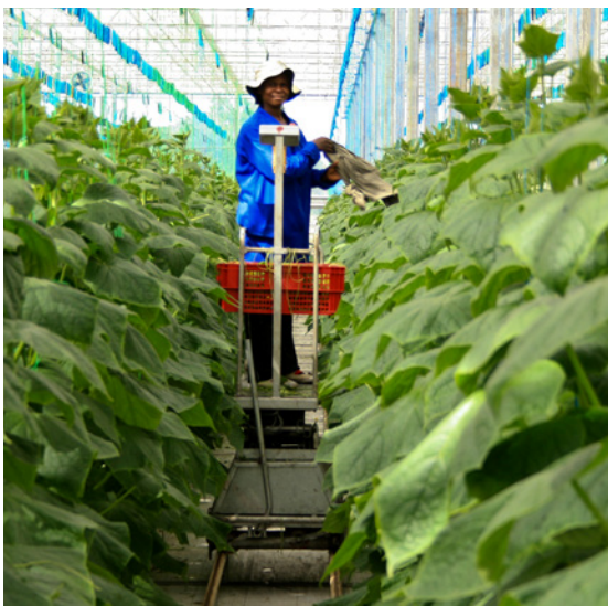
Mujer trabajando en una explotación agrícola de África Subsahariana.