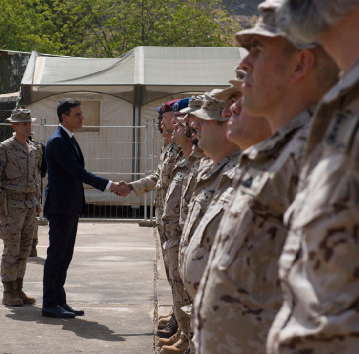
El Presidente del Gobierno, Pedro Sánchez, durante su visita en diciembre de 2018 al contingente militar español desplegado en Mali.

África y España somos vecinos próximos y socios estratégicos. Juntos podremos afrontar mejor los retos que nos afectan a ambos, desde el desarrollo económico y el empleo, a la descarbonización, la lucha contra la pobreza, el empoderamiento de las mujeres, la gestión de la migración o la paz y la estabilidad.