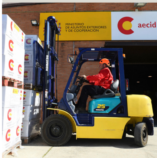
Almacén de ayuda humanitaria de la AECID en la Base Aérea de Torrejón de Ardoz.

Algunas medidas destacadas: i) Se concentrará en seguridad alimentaria y nutrición, protección y educación en emergencias, favoreciendo la coordinación y complementariedad entre actores humanitarios y de desarrollo; ii) en el contexto de emergencias, la respuesta podrá ser multidimensional, incluyendo agua, saneamiento e higiene; iii) también se hará hincapié en la protección de las mujeres y niñas en situaciones de conflicto, así como en su participación en todas las fases del conflicto y en los procesos de toma de decisiones, con una especial atención a su mayor vulnerabilidad ante la violencia sexual.