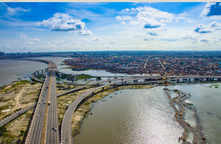
Vista de la ciudad de Lagos, Nigeria.

y de altos cargos españoles y africanos que propicien un diálogo fluido y constante y una intensificación de los intercambios.