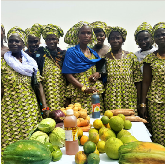
Cooperativa de mujeres en Casamance, Senegal.

España ha adoptado una política exterior feminista con el compromiso de apoyar el empoderamiento de mujeres y niñas en toda su acción exterior. Algunas medidas destacadas: i) potenciar el acceso de las mujeres a recursos económicos; ii) fomentar actuaciones que refuercen su liderazgo y participación en los espacios de toma de decisiones en la vida pública; iii) impulsar la agenda Mujeres, Paz y Seguridad; iv) reforzar las intervenciones para combatir la práctica de la mutilación genital femenina.