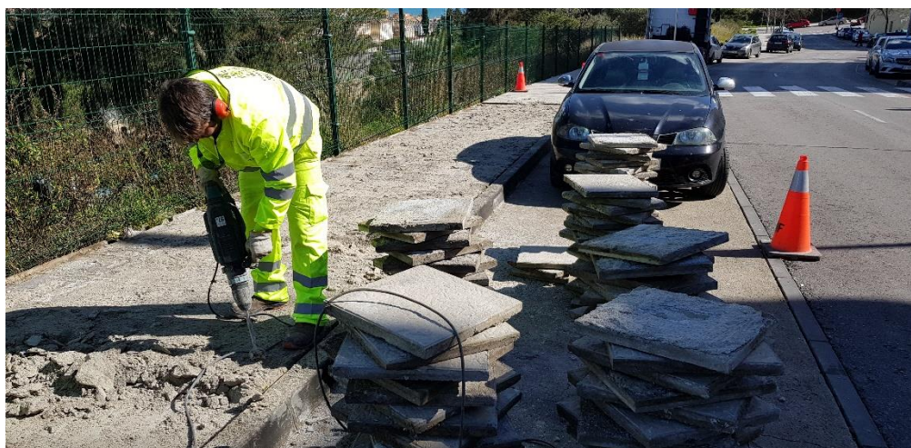
Reparación de acerado en N-357 p.k. 1

A continuación, se muestran algunas imágenes del sector y de los trabajos que se realizan con este tipo de contratos: