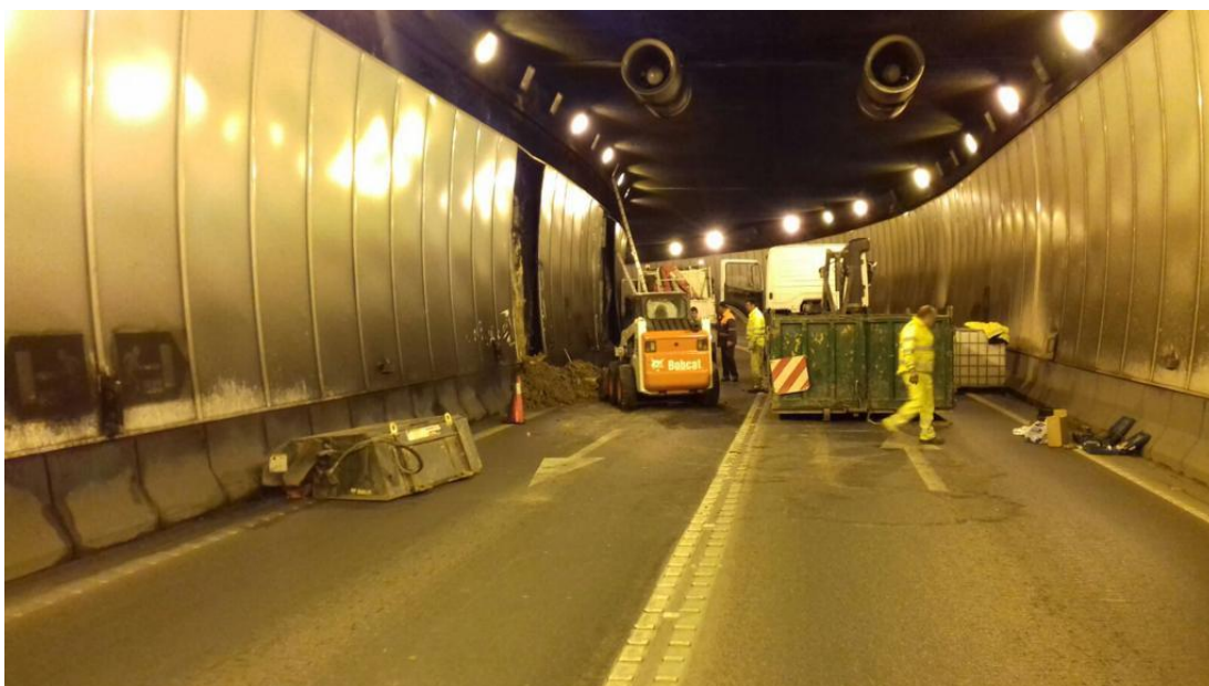
Refuerzo de intradós de pilotes en túnel N-357 p.k. 0