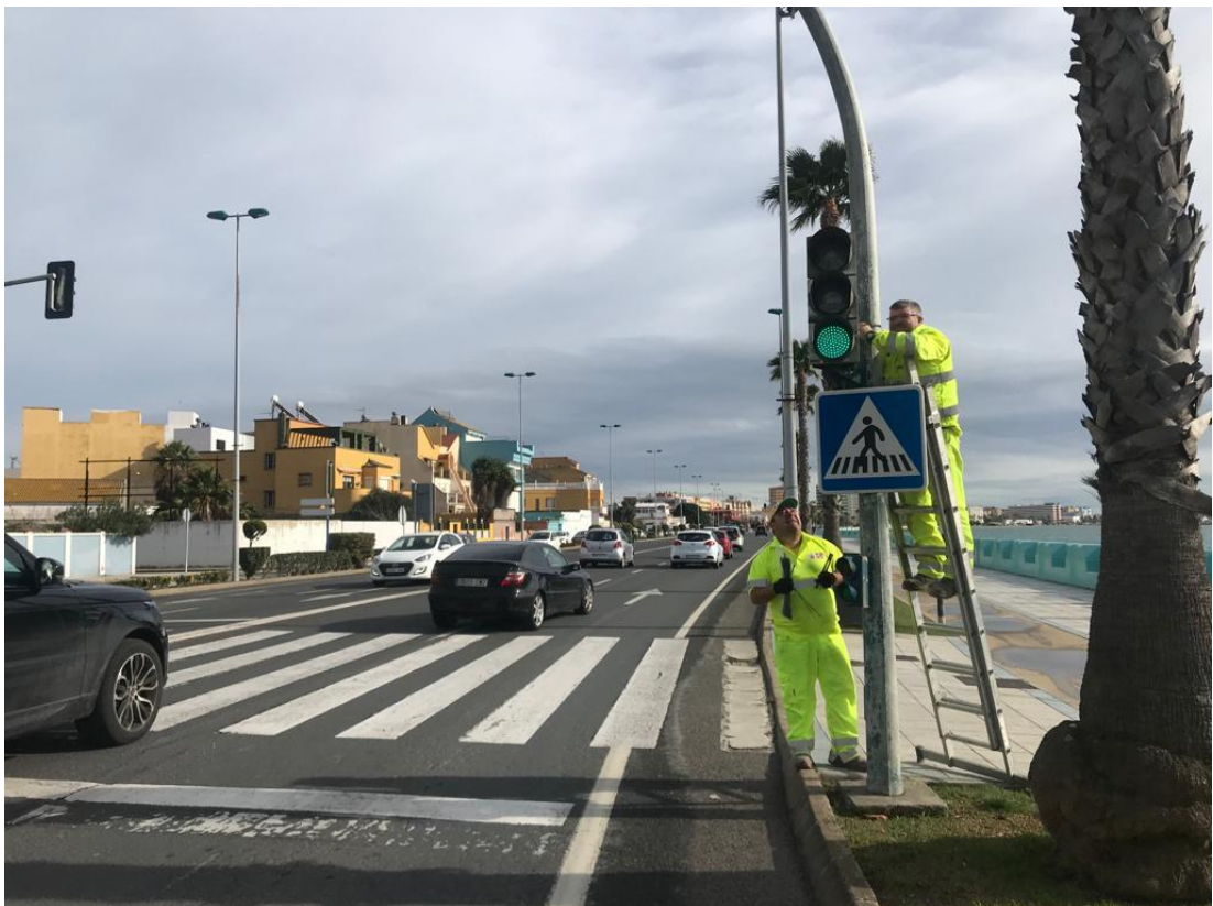
Reparación de semáforo en N-351; p.k. 5