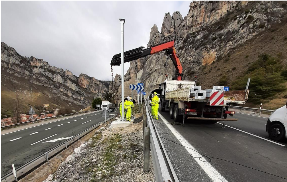
Modernización y mejora de la señalización vertical.