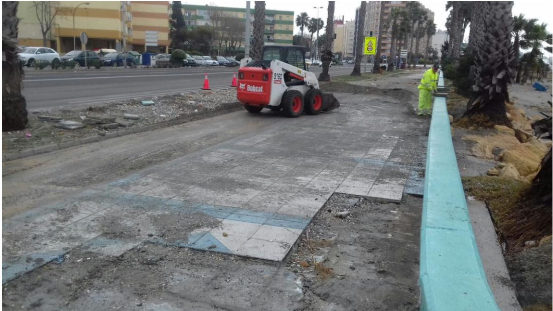
Limpeza de deterioros de temporal en la N-351 p.k. 6