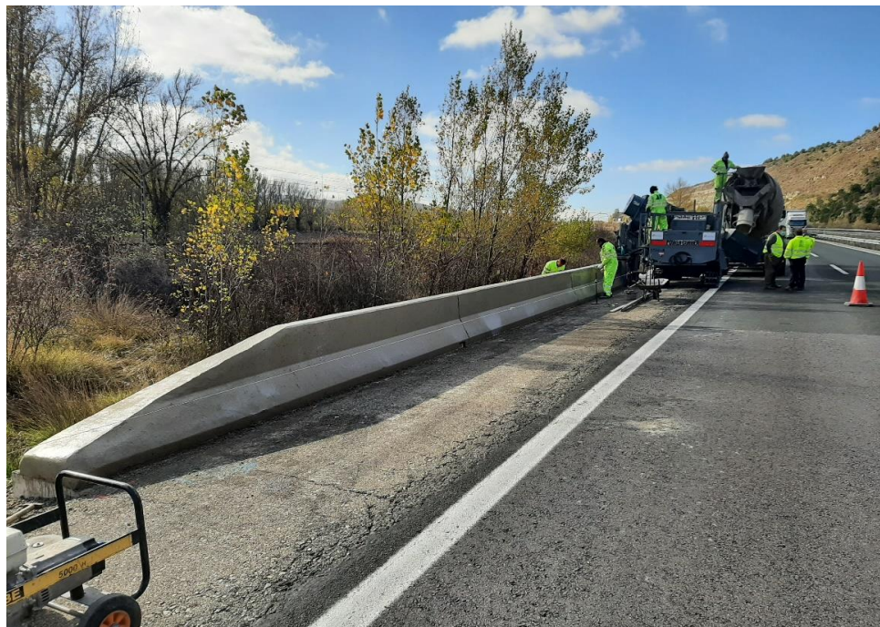
Modernización y mejora de sistemas de contención.