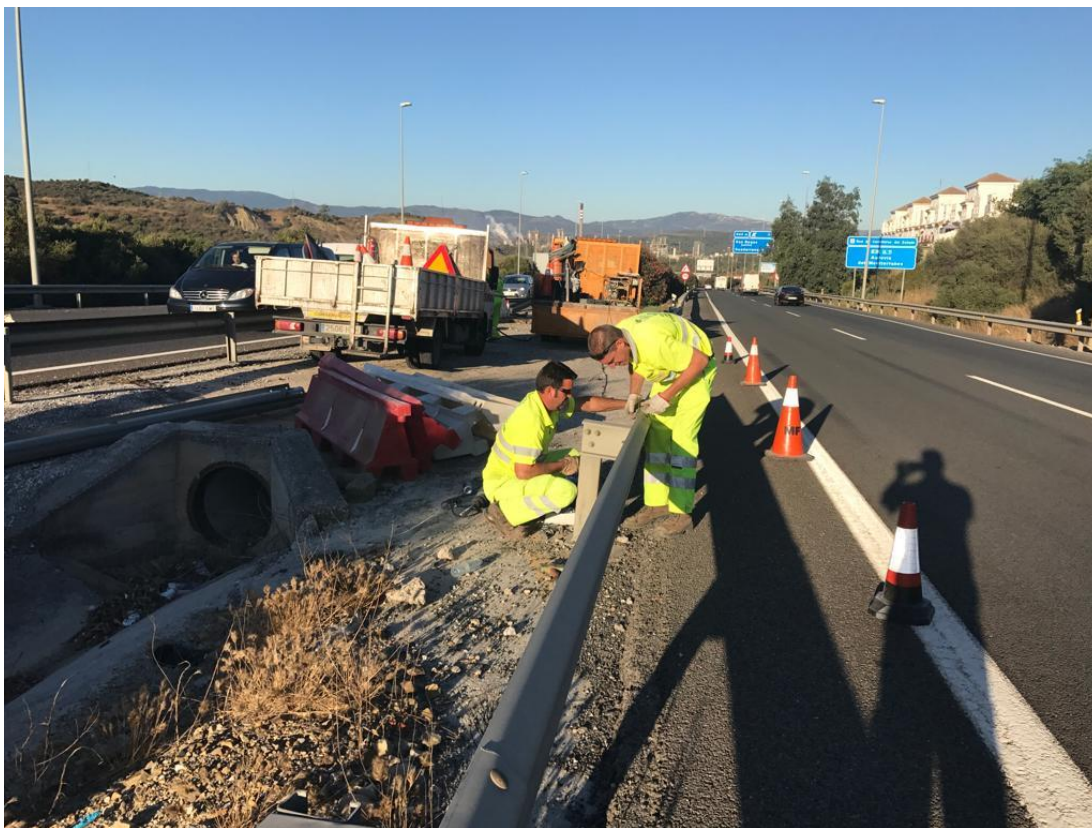
Reparación de barrera en A-7