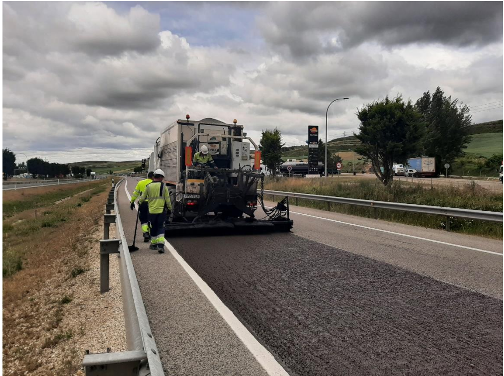
Rehabilitación del firme.