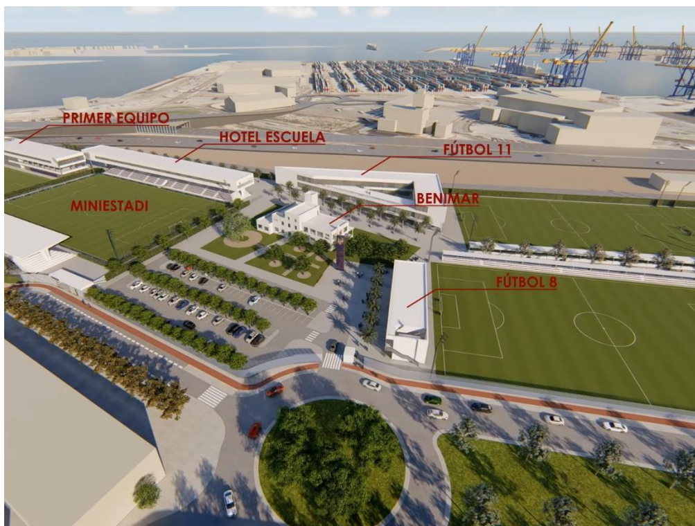
Ciudad deportiva Levante U.D.