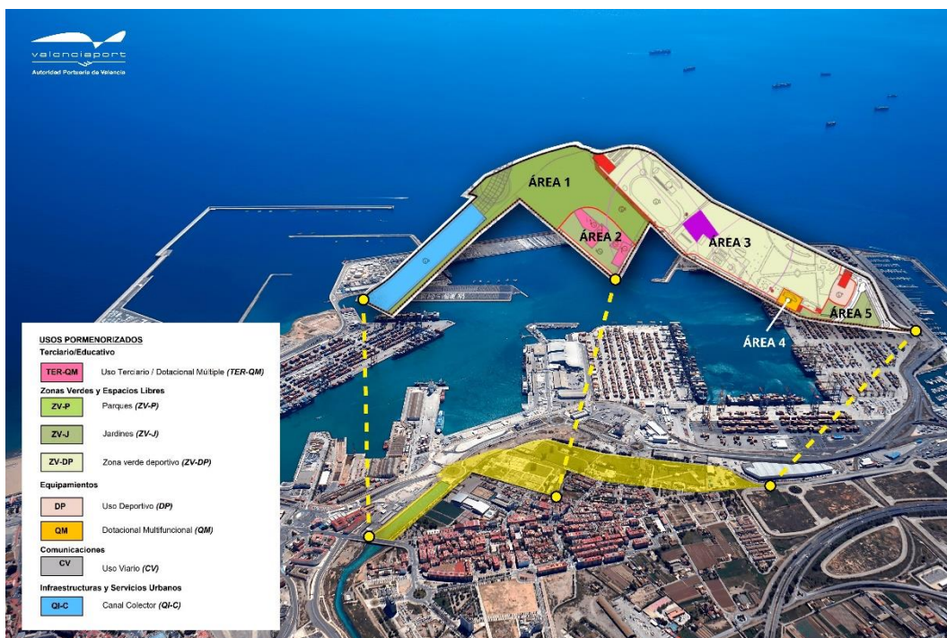
Plano general del proyecto

Tras una reciente medición, se obtiene una superficie total de 229.775'96 m 2 s (226.369,25 de las Áreas anteriormente descritas, a las que hay que añadir 3.136.369,25 de viales). Una superficie que, de acuerdo con el planeamiento vigente, 211.164'69 m 2 s son SU y 18.611'27 m 2 se clasifican como SNU, pero que se reclasifican a SU con el presente Plan Especial.