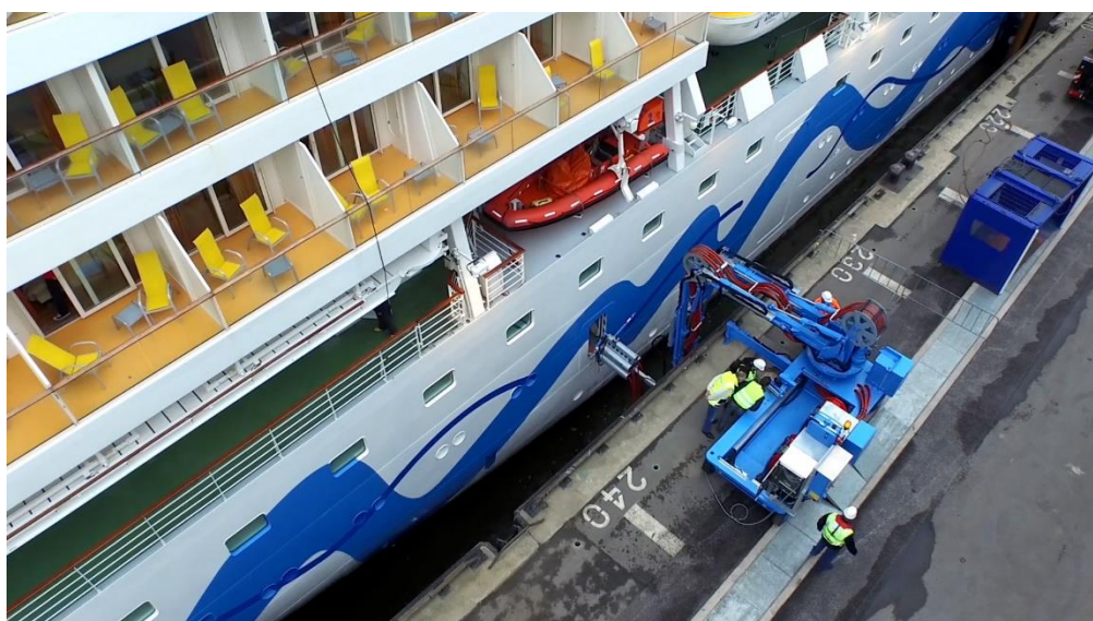
Conexión eléctrica de un buque

De esta forma, la Autoridad Portuaria de Valencia asegurará la correcta explotación de sus puertos, prestando todos los servicios que exige la puesta a disposición de las infraestructuras portuarias a los transportistas marítimos, tales como la coordinación, ordenación y control del tráfico, el de coordinación y control de las operaciones asociadas a la prestación de servicios portuarios y comerciales, los servicios de señalización y ayudas a la navegación, el servicio de alumbrado de zonas comunes, entre otros.