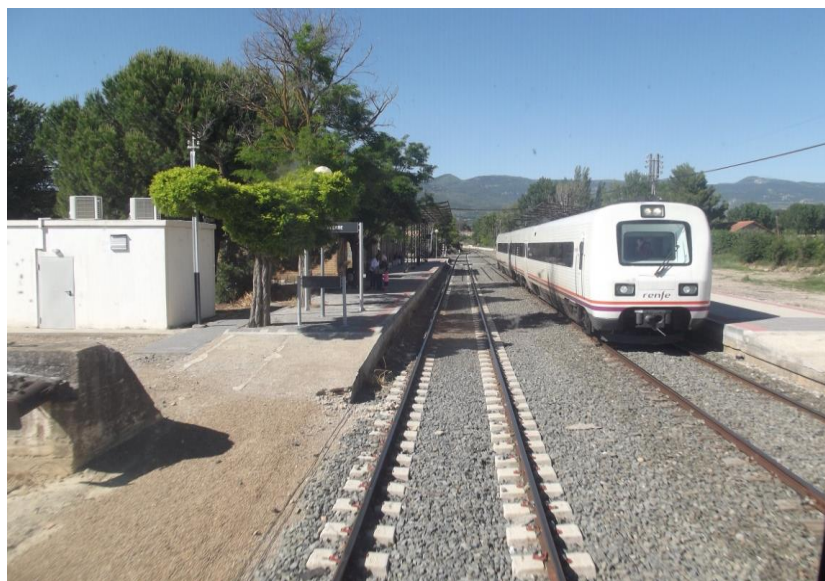
Estación de Ayerbe

Por último, se consolidará el edificio de la antigua estación de Bifurcación Turuñana, se adaptarán los andenes de las estaciones de Ayerbe y Plasencia del Monte, se renovará el pavimento de los pasos a nivel existentes en el tramo y se aumentará la protección de los pasos superiores.