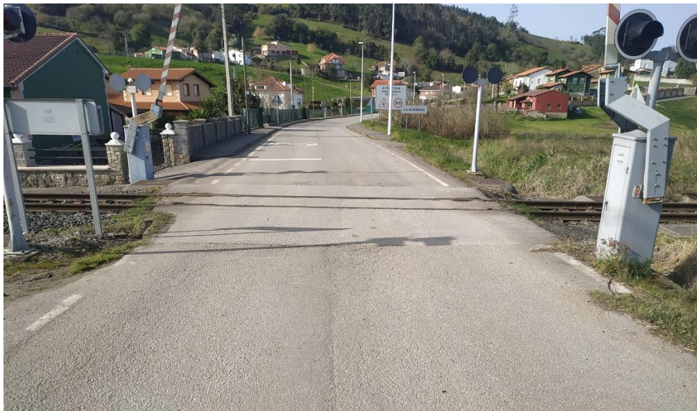
Paso a Nivel La Acebosa PN

Estas acciones contribuyen a la consecución de los Objetivos de Desarrollo Sostenible 3 (Salud y Bienestar), 9 (Industria, Innovación e Infraestructura) y 11 (Ciudades y Comunidades Sostenibles).