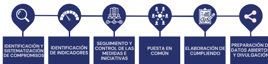
Figura Uno. Proceso de elaboración de la rendición de cuentas Cumpliendo

Con carácter general, un compromiso podría ser definido como una manifestación de la voluntad de llevar a cabo una iniciativa o conjunto de iniciativas con el fin de abordar una necesidad o solucionar un problema. Es, por tanto, una obligación contraída de forma voluntaria por quien la expresa.