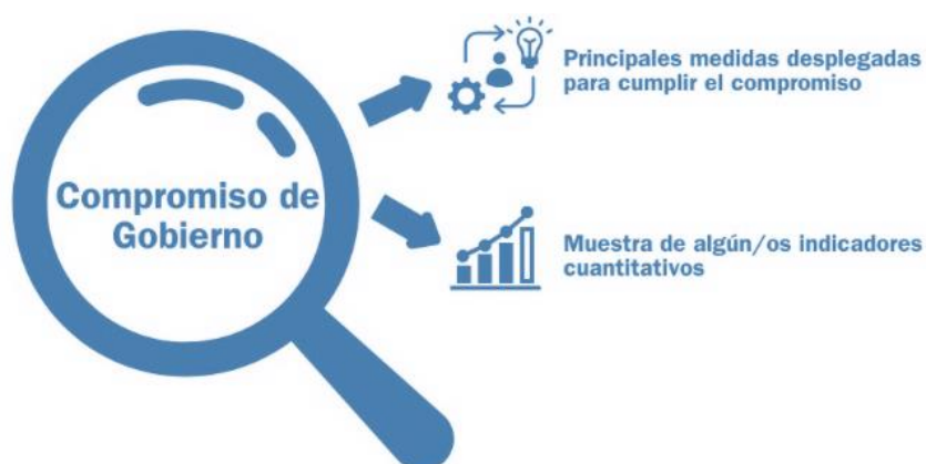
Figura Cinco. Aproximación a los compromisos.

La rendición de cuentas incorpora la cadena de resultados, herramienta lógica de amplio uso tanto en el diseño como en el análisis y evaluación de políticas públicas: el compromiso constituiría la finalidad u objetivo perseguido, mientras que las medidas e iniciativas son las medidas diseñadas e implementadas para obtener unos resultados.