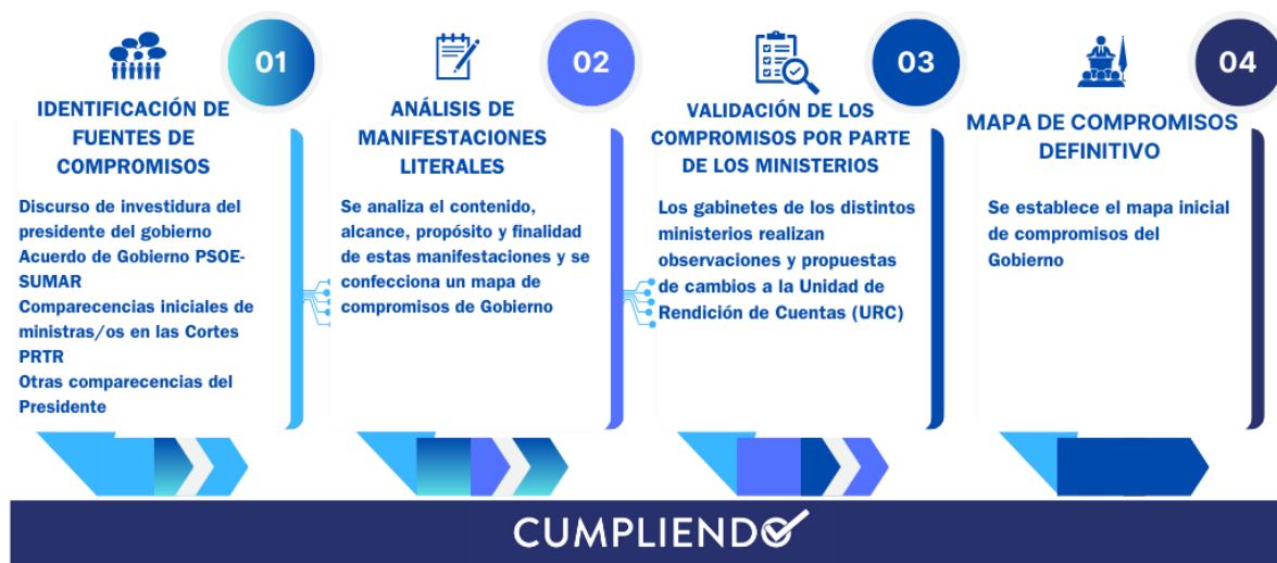
Figura Cuatro. Proceso de elaboración del mapa de compromisos