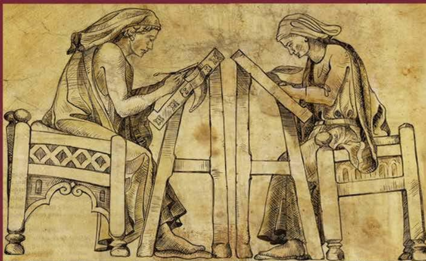
Idealización de un detalle de relieve de la Catedral de Burgos. Pablo Gutiérrez