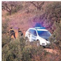
La Guardia Civil durante las tareas de rescate.

Sánchez pide a PP y Cs que se abstengan o voten a favor de sus cuentas