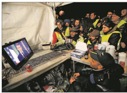
Un grupo de chalecos amarillos sigue la intervención de Macron cerca de Marsella.

MARC BASSETS París El presidente francés, Emmanuel Macron, anunció ayer, en un mensaje dirigido a la nación, una batería de medidas destinadas a contener a los chalecos amarillos . Los manifestantes que han puesto contra las cuerdas a su Gobierno. Macron prometió un aumento de 100 euros del salario mínimo, que se sitúa en 1194,92 euros netos, y que las horas extras en los fines de semana. También anulará a las empresas a abonar a sus trabajadores una paga de fin de año. "Queremos una Francia donde se pueda vivir dignamente del trabajo", afirmó. Con estos anuncios, el presidente rompe un silencio de una semana ante la crisis más grave de su mandato. Página 4