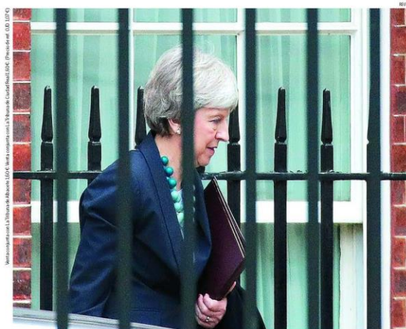
La primera ministra británica, Theresa May, sale de su residencia en Downing Street camino del Parlamento

El presidente no descarta ahora suspender la autonomía catalana tras acusar durante meses a Casado y Rivera de crispar EDIT VP_10