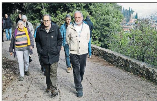
Torra se queda sin ceses en los Mossos. El president pasó el día de ayuno en Montserrat mientras el conseller Buch intentaba reconducir la crisis con los mandos de los Mossos y descartaba destituciones. POLÍTICA 15 A 17 Y EDITORIAL

► El Gobierno exige a la Generalitat un plan para garantizar el orden público ► JxCat y ERC se distancian de la vía eslovena y de las protestas violentas