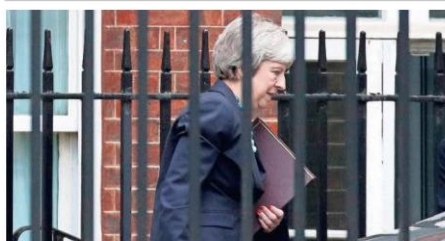
Theresa May, primera ministra británica, sale ayer del 10 de Downing Street, en Londres. 1207122

/ España. Santander planea ejercer la opción de compra sobre las preferentes que dio como compensación —P26— / EE UU. El interventor recupera el 70% del capital —P26-27—