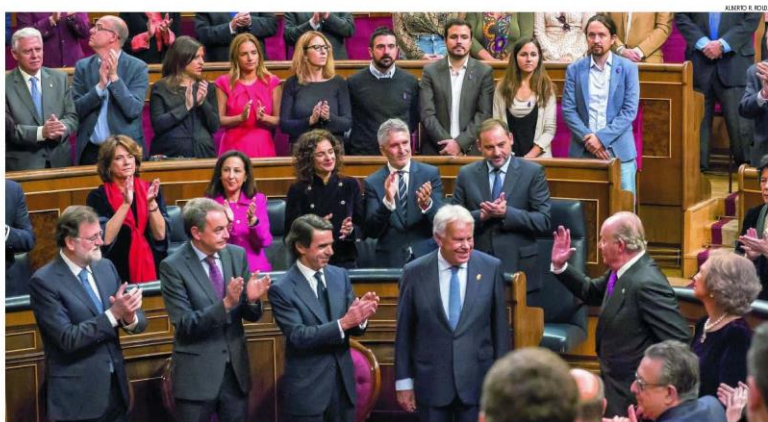
ESPECTÁCULO DE PODEROS. Don Juan Carlos recibe la ovación del Congreso ante los ex presidentes Rajoy, Zapatero, Aznar y González. Los diputados de Unidos Podemos hicieron «huelga» de brazos caídos

EL ACTO EN EL CONGRESO DEL 40 ANIVERSARIO DE LA CARTA MAGNA SE CONVIERTE EN UN HOMENAJE A LA CORONA PRIMERA PLANA P. 10 A 17