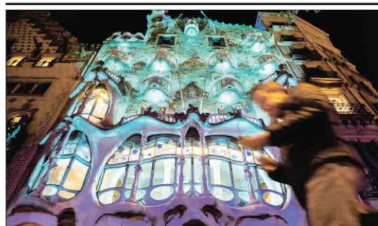
Iluminación especial para Gaudí. La casa Batlló (en la fotografía) y la Pedrera acaban de estrenar iluminación festiva; la segunda ha sido realizada por alumnos de la escuela de diseño Elieva. La Sagrada Família se les unirá el 21 de diciembre. VIVIENDA 2

► Los independentistas supeditan las cuentas a una solución para Catalunya ► Consideran "un chantaje" la amenaza de una victoria de la derecha con Vox POLÍTICA 13