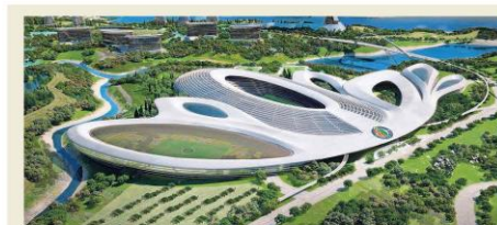
Elysium, el nuevo Eurovegas para la Siberia extremeña. Nuevo intento para construir un gigantesco Eurovegas con casinos, hoteles, ocio, viviendas, centro comercial, un puerto deportivo e incluso un estadio en la comarca de la Siberia extremeña. Tras el abandono del anterior promotor, el grupo Cota Global presentó ayer Elysium City, con una inversión prevista de 3.500 millones de euros que habrá que ver si sale adelante o se frustra como anteriores proyectos. —P3

/ Relevo El vuelco puede afectar a 300 entes, incluyendo 50 sociedades mercantiles / Cuentas La Junta tiene 270.000 empleados y 35.000 millones de presupuesto —P25