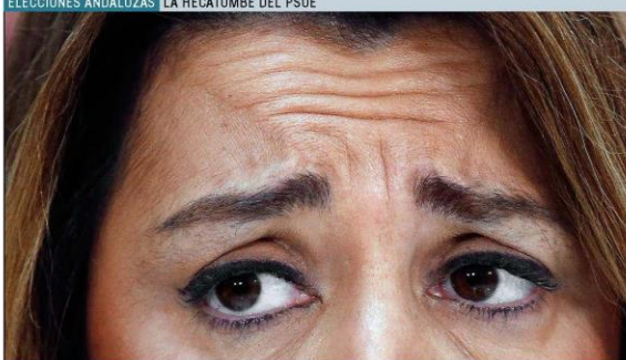
La presidenta en funciones de la Junta de Andalucía, Susana Díaz, ayer durante la rueda de prensa celebrada en Sevilla.

ELECCIONES ANDALUZAS LA HECATOMBE DEL PSOE