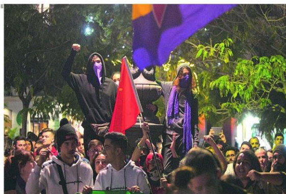
Cientos de estatistas se manifestaron con banderas republicanas en varias ciudades andaluzas tras la llamada de Podemos

Iglesias moviliza la calle contra Vox, que advierte: «Cuanto más nos insulten más nos van a apoyar»