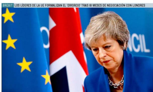
La primera ministra de Reino Unido, Theresa May, abandona el Consejo Europeo tras la aprobación, ayer, del Brexit.

• El fracaso es una gran oportunidad para empezar otra vez (Henry Ford) •