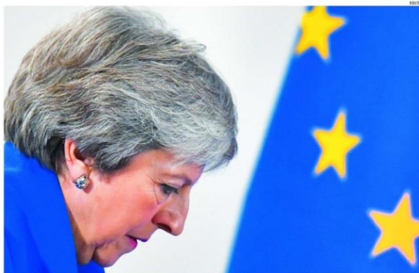
La «primera» británica, ayer hizo su comparecencia en Bruselas. Fue la única que dijo no sentirse «tráiste»