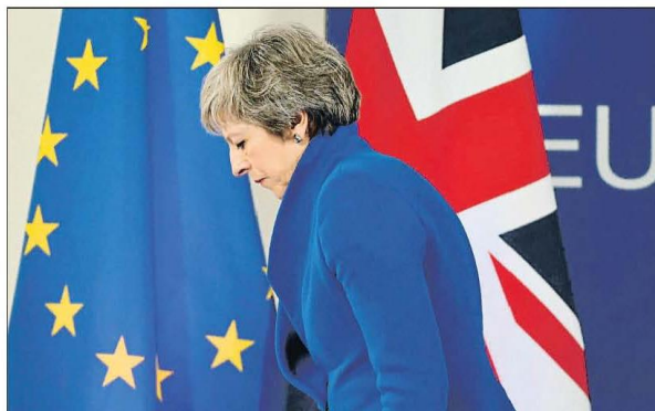
Divorcio poco amistoso. May afronta ahora una batalla en el Reino Unido para aprobar las condiciones del divorcio con la UE

► Los 27 lamentan el divorcio, pero avisano de que no habrá más concesiones ► La premier afronta sin mayoría la batalla interna por el pacto INTERNACIONAL 3 Y 4