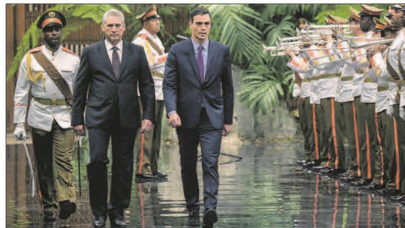
APOYO ESPAÑOL AL APERTURISMO CUBANO. Pedro Sánchez expresó ayer en La Habana su respaldo al "impulso reformista" del nuevo presidente cubano, Miguel Díaz-Canel. En la imagen, los dos mandatarios en un acto en el Palacio de la Revolución. / www.ana.uy Fotos: A. G.

en la misma con una nueva pareja. Los expertos lo consideran una revolución en el derecho de familia, pues hasta ahora los juzgados tendían a dar prioridad al interés de los menores. Fotos: A. G.