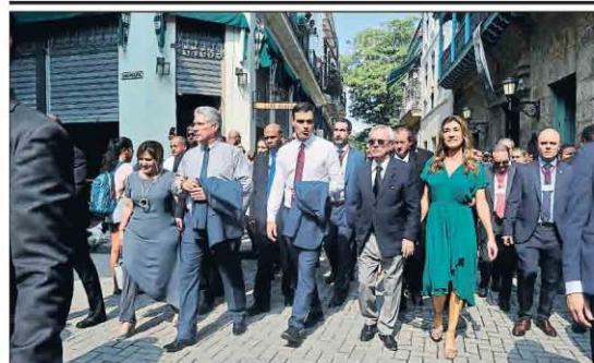
Primera visita oficial a Cuba en 32 años. Pedro Sánchez pasó ayer por La Habana con el presidente Díaz-Canel. No se vio con la oposición al régimen porque «aseguró» lo importante es que antes vayan los Reyes a la isla. POLÍTICA 13 Y EDITORIAL

► El presidente apunta que se aplazará la cumbre de mañana si no se incluye Gibraltar ► La UE negocia con May una declaración sobre el futuro del Peñón INTERNACIONAL 374