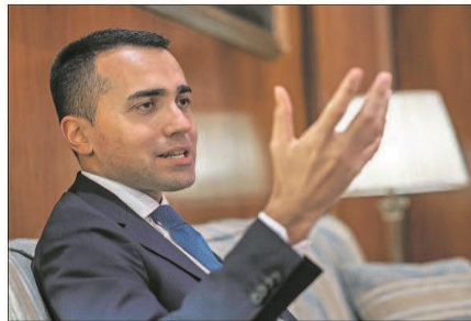
Luigi Di Maio, en su despacho en Roma durante la entrevista.