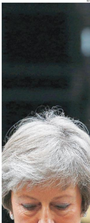
May aseguró que había dejado «claro» a Sánchez en una conversación telefónica que «la soberanía de Gibraltar será protegida»

Carmena expulsa de su plataforma electoral a Podemos p. 20