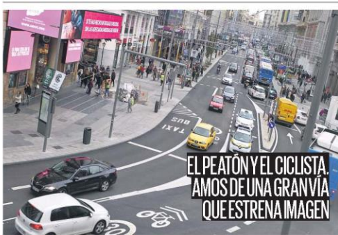
La arteria de la capital luce desde hoy nuevo mobiliario, más árboles y mejor iluminación. La alcaldesa inaugurará la remodelación a las 19.00 h. PÁGINA 4

REUNIÓN El líder regional pide fondos para inmigración y mejoras en Cercanías y accesos COMPROMISO Sánchez solo garantiza el desbloqueo del proyecto de la variante de la A-1 PÁGINA 2