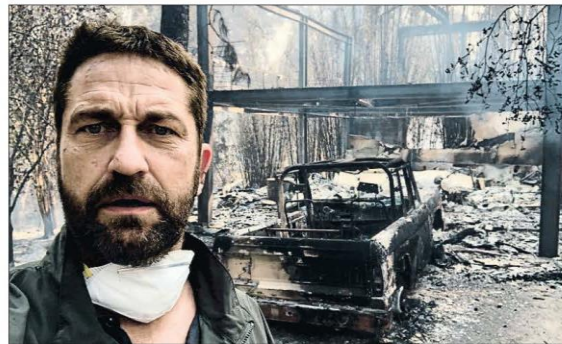
Inferno en California. El actor Gerard Butler es uno de los famosos que han perdido su casa de Malibú en los devastadores incendios que han provocado 31 muertos y 200 desaparecidos en California. INTERNACIONAL 3 Y 4

► El nuevo presidente del TS encabezaba el tribunal que juzga a los independentistas ► El relevo sitúa a una juez progresista en el caso del 'procés' POLÍTICA 13 Y EDITORIAL