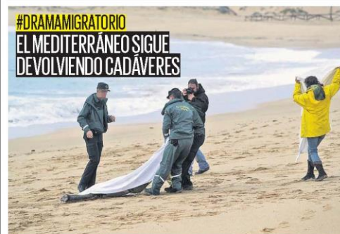
La recuperación, ayer, de 5 cadáveres en la playa de Los Caños de Meca, en Barbate (Cádiz), eleva a 18 las víctimas del naufragio de una patera, uno de los siniestros más luctuosos. PÁGINA 12