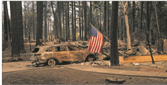
MÁS DE 200 DESAPARECIDOS EN EL FUEGO EN CALIFORNIA. El incendio que desde hace días devasta el norte de California ha dejado ya 29 muertos y más de 200 desaparecidos. En la foto, restos de una casa y un coche en la localidad de Paradise.

la independencia del 9-N de 2014. Mas, que ya fue condenado a inhabilitación para ejercer cargos públicos por la vía penal, calificó de "aberración judicial" la sentencia y anunció que la recurrirá.