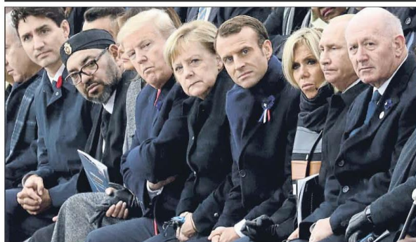
Trudeau, Mohamed VI, Donald Trump, Angela Merkel, el matrimonio Macron, Putin y el australiano Cosgrove en el Arco de Triunfo

► Casi el 70% de los españoles y los catalanes prefieren esa opción a un referéndum ► Mejorar la financiación de Catalunya es la segunda vía preferida POLÍTICA 12, 13 Y EDITORIAL