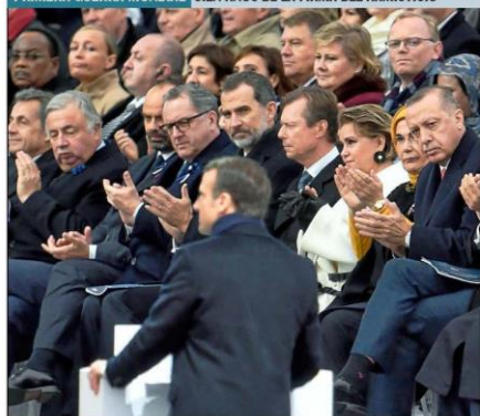
El Rey (centro) escucha el discurso del presidente francés, Emmanuel Macron (de espaldas), ayer en París.

PRIMERA GUERRA MUNDIAL. CIENTOS AÑOS DE LA FIRMA DEL ARMISTICIO