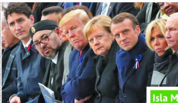
Trudeau, Mohamed VI, Trump, Merkel, Macron y su mujer Brigitte y Vladimir Putin, ayer en la conmemoración