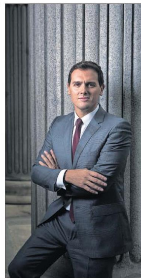
Albert Rivera, el jueves, en el Congreso.