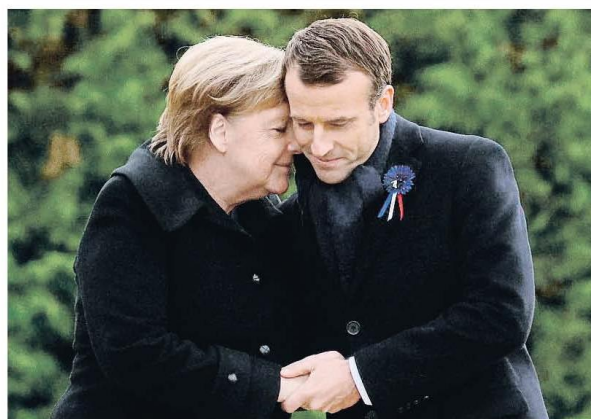
Cien años después... La canciller Merkel, junto al presidente Macron, se convirtió ayer en la primera líder de Alemania en pisar Compiègne, localidad francesa donde su país firmó hace cien años el armisticio de la Gran Guerra. INTERNACIONAL 30

Pedro Sánchez no piensa convocar elecciones aunque no haya presupuestos