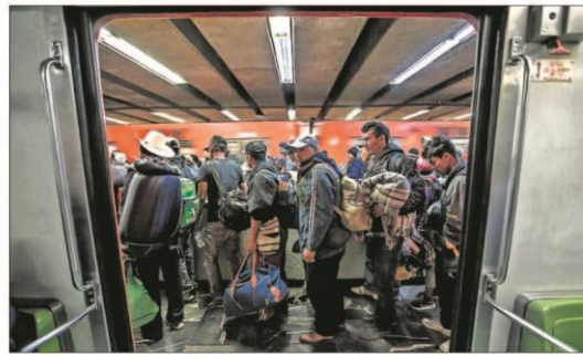
TRUMP IMPONDRÁ MÁS TRABAS LEGALES A LOS INMIGRANTES. El presidente de EE UU firmó ayer una orden que deniega asilo a los migrantes que cruzan legalmente la frontera sur. En la foto, miembros de la caravana, en Ciudad de México. Página 2

trovertidos que hoy sitúan a la Iglesia en el centro del debate. Justifica las condenas en las causas de sacerdotes: "El cura vive en la parroquia como el farero en el faro o la Cuarenta y Cuatro en la casa cuarenta. El cura es cura las 24 horas del día y atiende a la gente 24 horas al día". Página 27