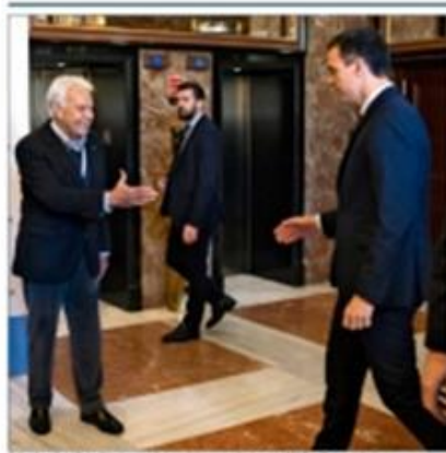
José Ignacio Wert y Pedro Sánchez conversando en un pasillo del Ministerio de Educación.