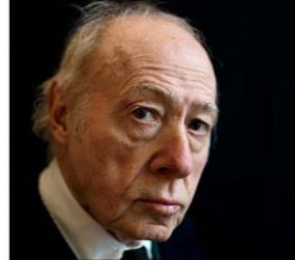
FALLECE EL PINTOR MADRILEÑO A LOS 81 AÑOS