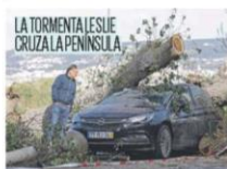
LA TORMENTA LESUE CRUZA LA PENINSULA PÁGINA 6

El TS obliga a una empresa a dar la cesta de Navidad que no entregó en 2016 PÁGINA 6