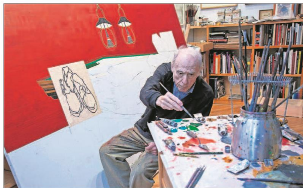
MUERE EDUARDO ARROYO, UN ARTISTA RADICAL. Eduardo Arroyo, pintor clave del siglo XX, además de creador plástico, escritor y escultor, falleció ayer en Madrid a los 81 años. Su fallecimiento se produce tras año y medio de actividad frenética, entre exposiciones, cuadros y escritos. En la imagen, Arroyo, en febrero de 2017 mientras pintaba Van Gogh en el buller de Auvers-sur-Oise . Página 30 y 31

con EL PAÍS: "Me extraña que quien luchó por la democracia sea neutral ante Bolsonaro", afirma. También asegura que con un candidato como el exmilitar, ganador de la primera vuelta, "la democracia brasileña está en peligro". "Todo puede pasar", añade Haddad. Páginas 2 y 3