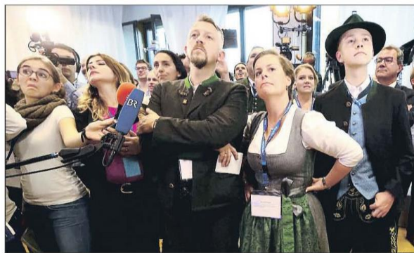
Decepción en Múnich. Los seguidores del partido conservador CSU no ocultaban ayer durante el recuento de votos su disgusto por los malos resultados cosechados en los comicios celebrados en el land de Baviera

► La CSU bávara, con el 37% del voto, cosecha el peor resultado en 60 años ► Alternativa para Alemania se estrena con el 11% de los sufragios INTERNACIONAL 3